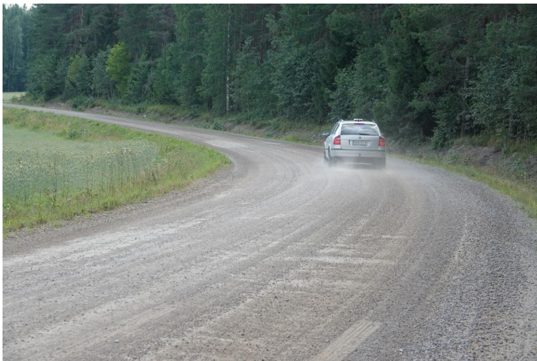
Kuva 15. Tie pölyää vähän. Pöly ei leviä pientareita kauemmaksi. Kuntoarvo 3, alaraja.