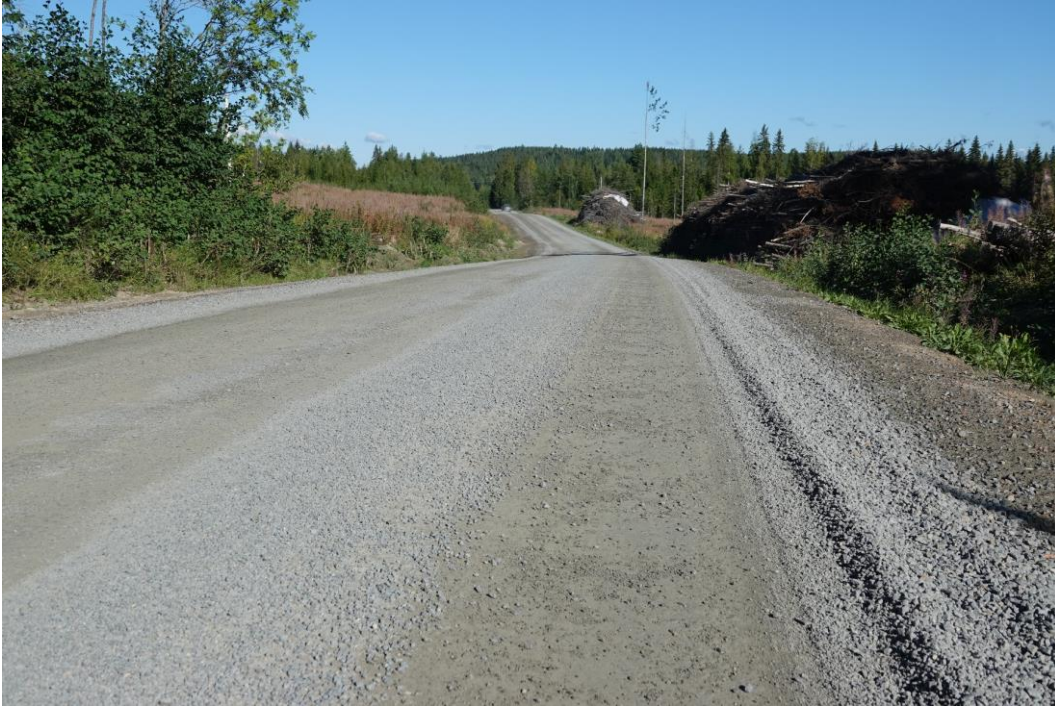
Kuva 11. Tien kiinteää pintaa näkyy paikoitellen irtoaineksen alta. Kallisarvoinen kiviaines on kulkeutunut tien luiskaan. Kuntoarvo 2, alaraja.