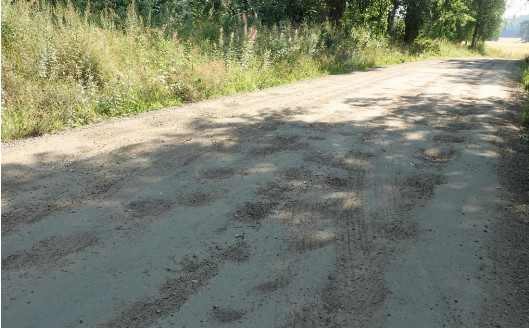
Kuva 1. Tien pinnalla on kuoppia, ja ajonopeutta on hiljennettävä. Kuntoarvo 1.