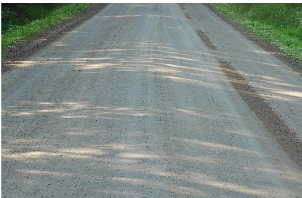
Kuva 8. Tien pinta on tasainen, kiinteä ja pölyämätön. Kuntoarvo 3.