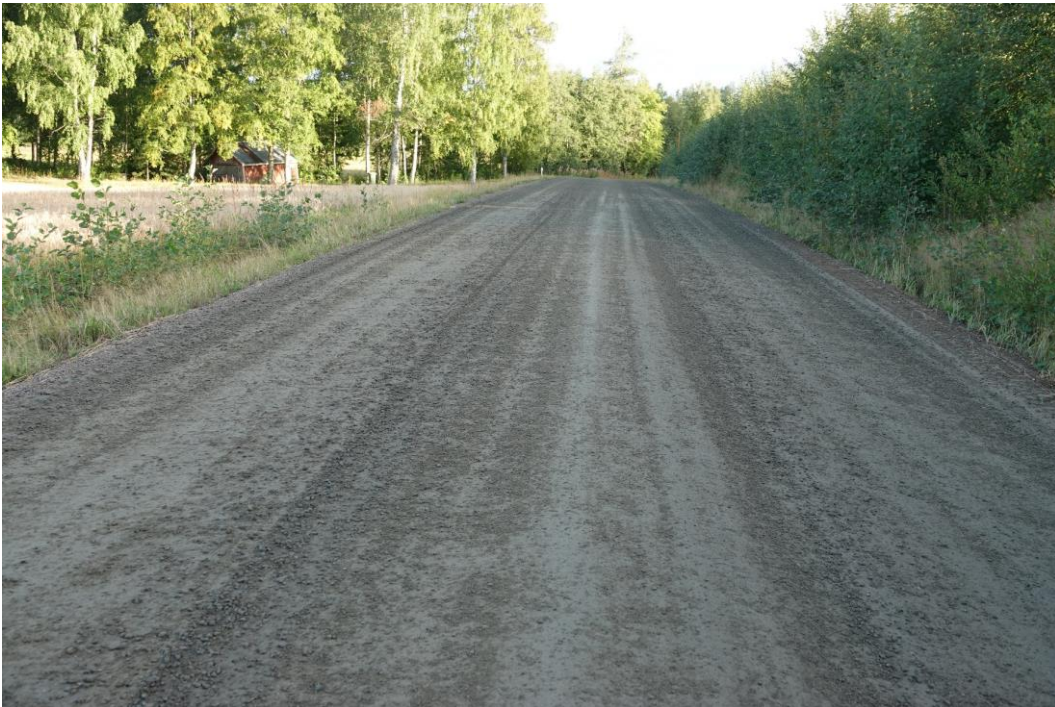
Kuva 12. Tie on yleisilmeeltään kiinteä, ajourien välissä ja reunoilla voi olla vähän. Kuntoarvo 3, alaraja.