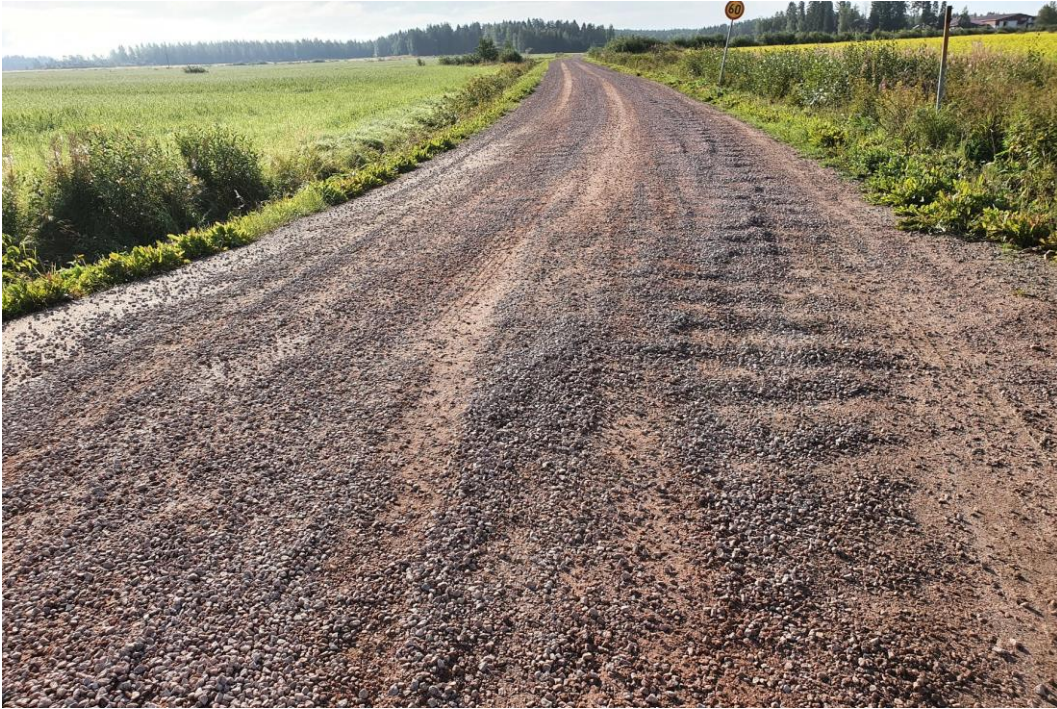
Kuva 9. Tien pinta on koko leveydeltään paksun irtoaineksen peitossa. Kuntoarvo 1.