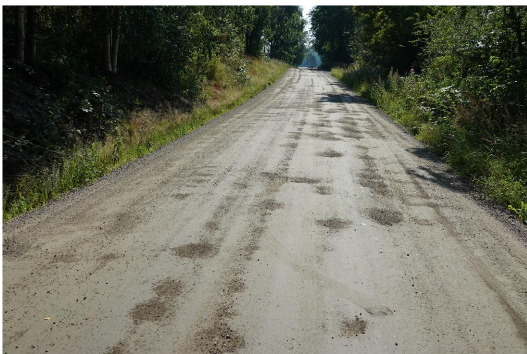
Kuva 4. Tien pinnalla on kuoppia, joita ei pysty väistämään omalla ajokaistalla. Kuntoarvo 2, alaraja.