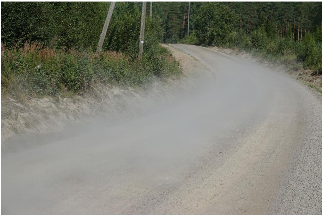
Kuva 14. Pöly ei leviä tiealueen ulkopuolelle. Pöly haittaa lievästi näkyvyyttä. Kuntoarvo 2, alaraja.