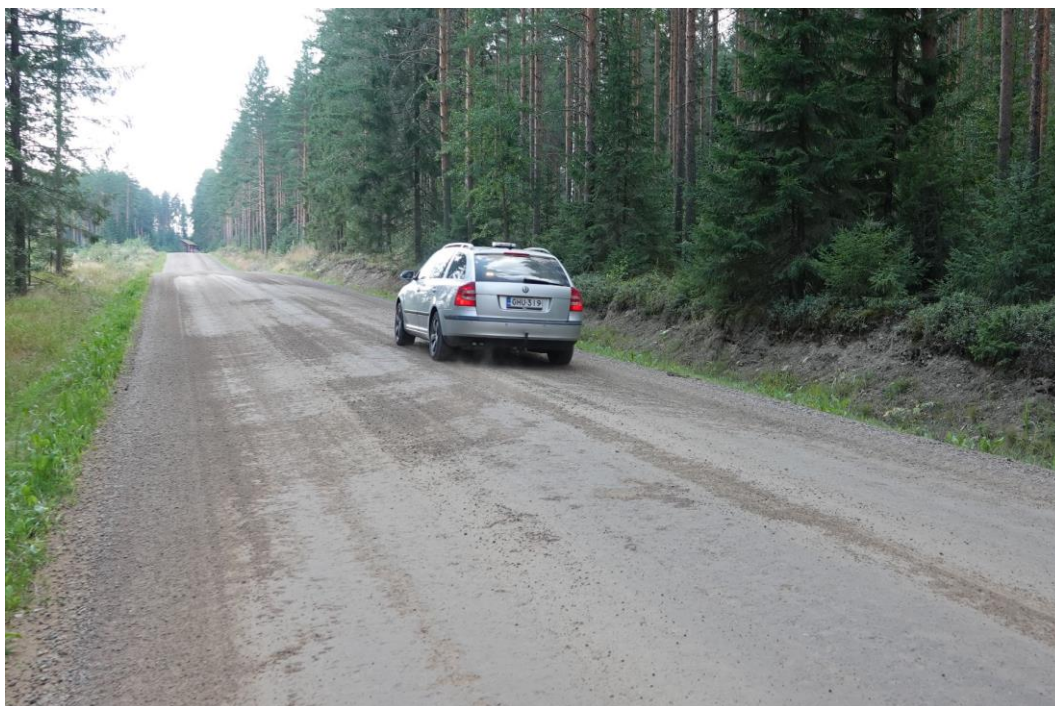
Kuva 16. Pientä pölyämistä renkaiden takana havaittavissa. Kuntoarvo 3.