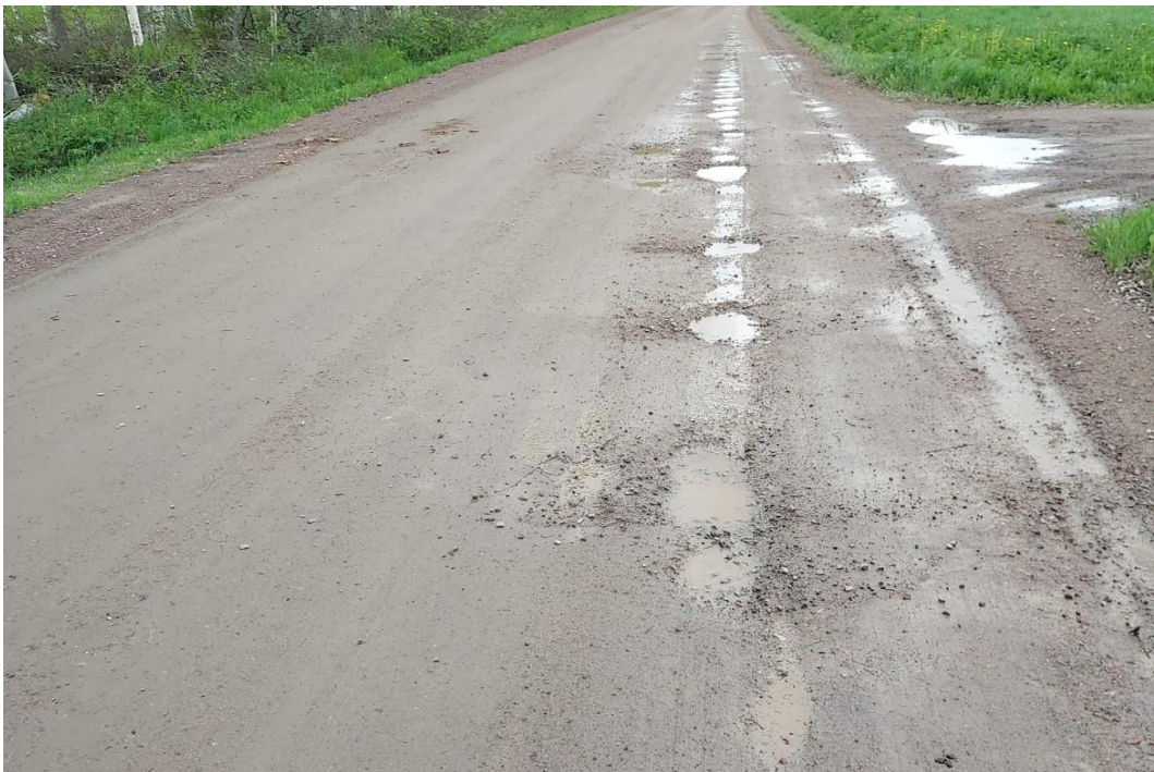
Kuva 6. Tien pinnalla on epätasaisuuksia, mutta ajonopeutta ei tarvitse hiljentää niiden vuoksi. Riittämätön sivukaltevuus ja reunapalle ovat osasyynä kuoppien syntyyn. Kuntoarvo 3, alaraja.