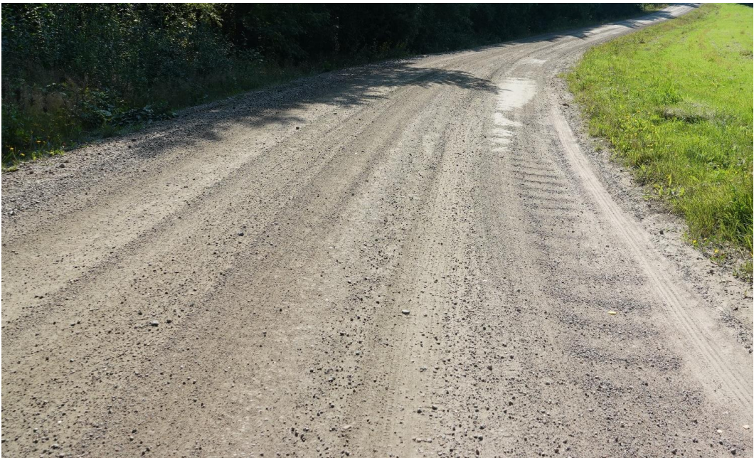
Kuva 2. Tien pinnalla on pyykkilautaa, jota ei pysty väistämään omalla ajokaistalla. Kuntoarvo 2, alaraja – vähänkään huonompi pintakunto vastaisi kuntoarvoa 1.