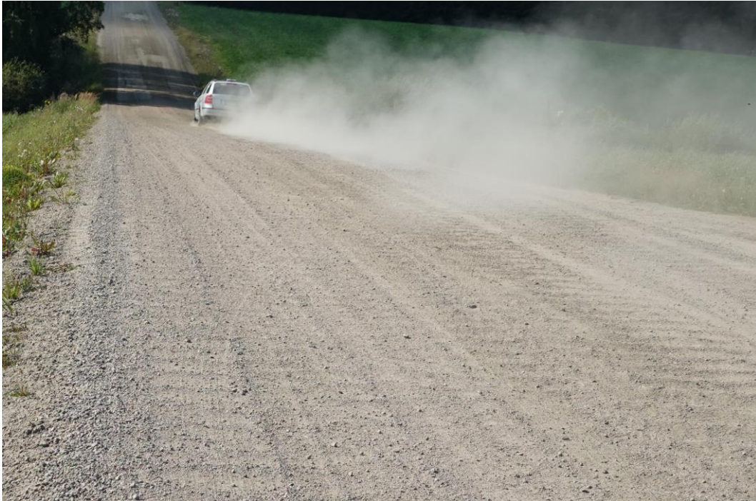
Kuva 13. Pöly leviää tiealueen ulkopuolelle. Pöly haittaa näkyvyyttä ja aiheuttaa haittaa tienvarren asutukselle ja viljelyksille. Kuntoarvo 1.