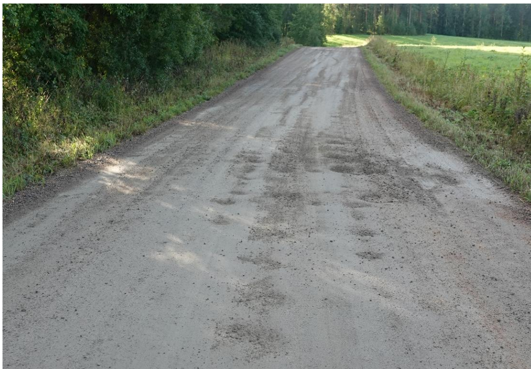
Kuva 3. Tien pinnalla on liikennettä mahdollisesti vaarantava kuopparyhmä. Kuntoarvo 2, alaraja.