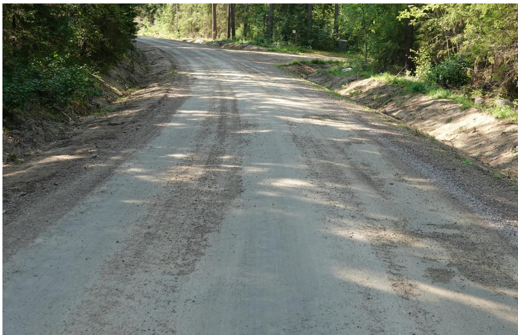
Kuva 7. Tien pinnalla on pieniä epätasaisuuksia, mutta ajonopeutta ei tarvitse hiljentää niiden vuoksi. Kuntoarvo 3.