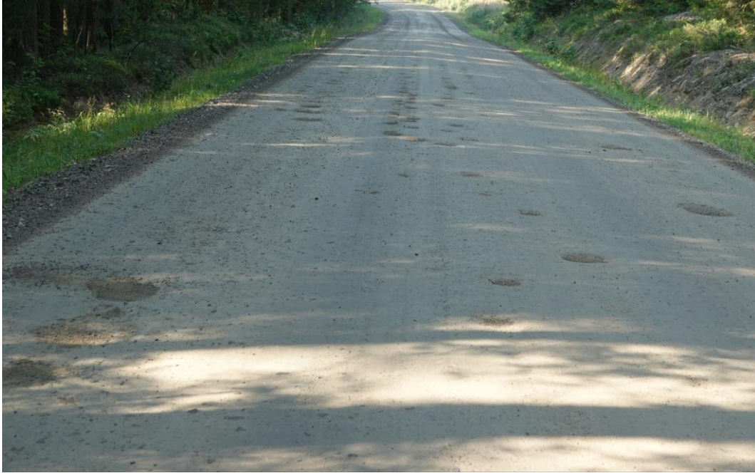
Kuva 5. Tien pinnalla on pienehköjä kuoppia, joita ei tarvitse väistellä eikä niiden vuoksi tarvitse hiljentää ajonopeutta. Kuntoarvo 3, alaraja.