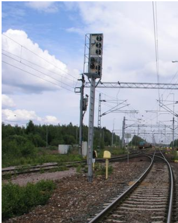
Kuva 1: Neliöpoikkileikkauksinen opastinmasto

Käyttösuunnitelma on laadittu rakennetyyppikohtaisesti neliöpoikkileikkauksiselle opastinmastolle (Kuva 1). Käyttösuunnitelma ei muuta muita voimassaolevia ohjeita ja määräyksiä, joita tulee kaikissa tapauksissa noudattaa.